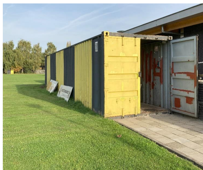
Een van de klussen, het opknappen van de container. Hier kwam nog veel laswerk aan te pas. In de verte ook de opgeknapte en geschilderde dug-out.